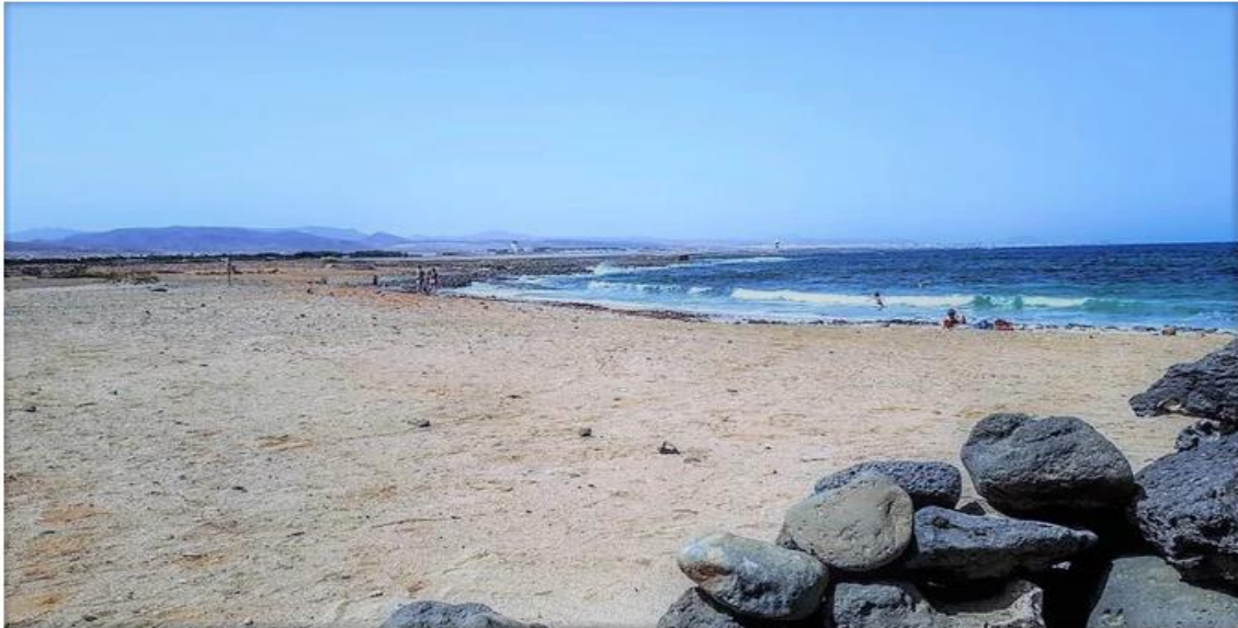
Playa Natural las Caletillas 1 km

Playa Natural de las Caletillas ist ein ruhiger Strand, an dem nur wenige Menschen kommen und der genügend Platz bietet, um die Sonne zu genießen. Spezielle kreisförmige Steinmauern sorgen dafür, dass Sie im Schutz des allgegenwärtigen Windes liegen können, es gibt Ihnen auch die private Atmosphäre, als wäre es Ihr eigener Platz. Da es am oder am Strand keine Einrichtungen gibt, können Sie die Strandtücher in der Wohnung benutzen. Am Strand stehen Mülleimer zur Verfügung. Der Strand ist garantiert ruhig und Sie werden keine großen Menschenmassen sehen. So schön und ruhig. Sie können diesen Strand nur zu Fuß erreichen. Gehen Sie in nördlicher Richtung und folgen Sie dem Weg entlang des Gartencenters und Sie gelangen automatisch zum Eingang des Strandes. (Achtung: kein FKK-Strand)