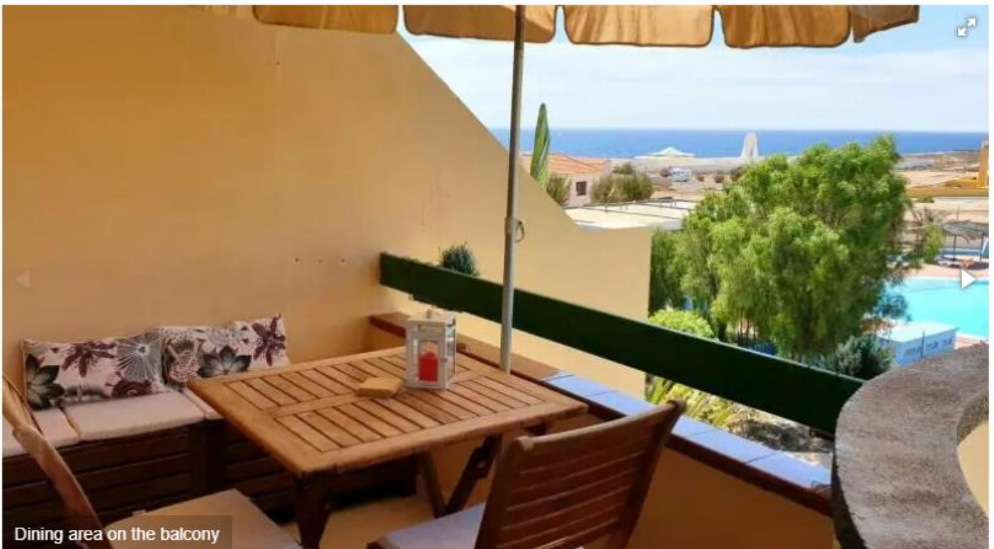
Dining area on the balcony

Charmante Ferienwohnung für 4 Personen und mit 1 Schlafzimmer in Costa de Antigua Caleta de Fuste. Das Apartment befindet sich im 2. Stock und verfügt über eine kompakte, gut ausgestattete Küche für die Zubereitung von Mahlzeiten. Auf dem Balkon, mit Meerblick, können Sie Ihr Frühstück oder Abendessen im Abendlicht genießen. Wenn es auf dem Balkon zu heiß wird, können Sie sich im großen Gemeinschaftspool der Apartmentanlage Bouganville abkühlen.